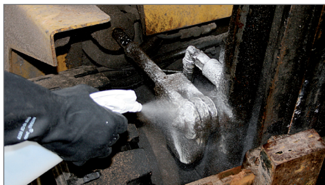
Nastříkejte a nechte působit