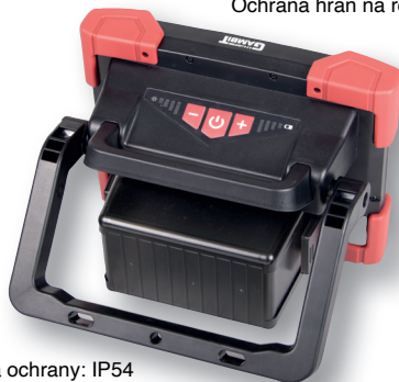
Třída ochrany: IP54