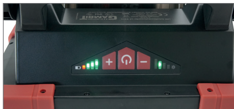
Displej úrovně osvětlení a baterie