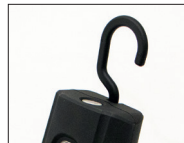
háček pro zavěšení